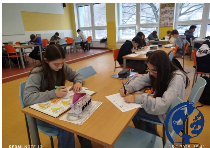
Zeměpisná olympiáda - školní kolo.