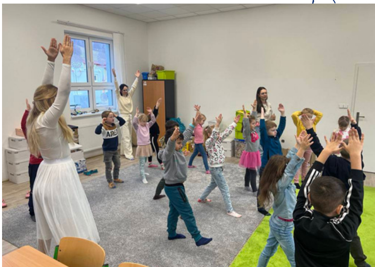
Zážitkový program pomocí metody EMDR.