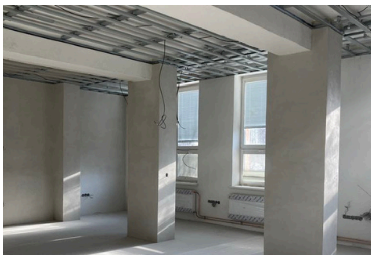
Příprava prostor pro novou sborovnu I. stupně.