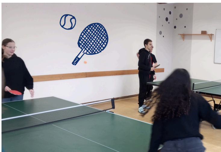
Ping-pong, jedna z nových oblíbených aktivit v tělocviku i během přestávek.