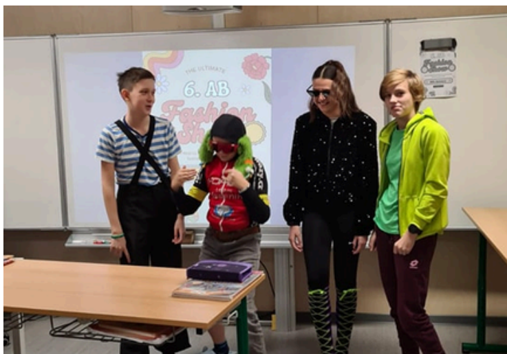
Fashion Show v hodině angličtiny.