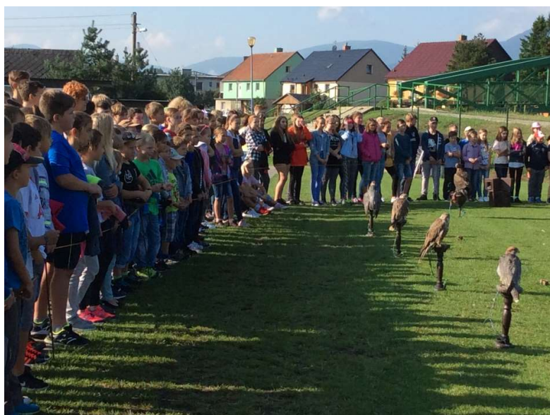
Ukázka letu dravců (Seiferos)