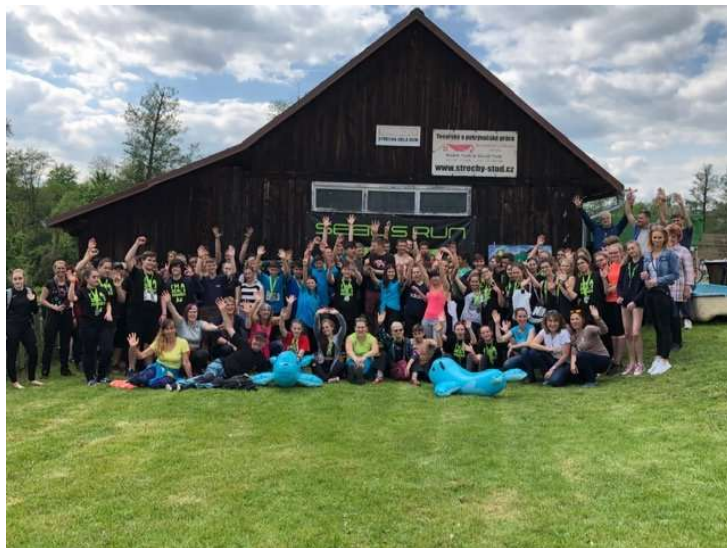
Setkání naší a partnerské školy ze Stoda u Plzně