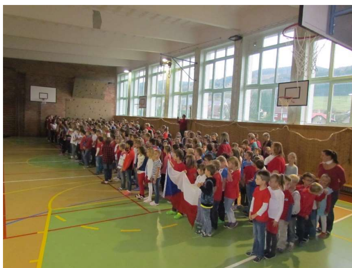
Školní projekt – 28. říjen