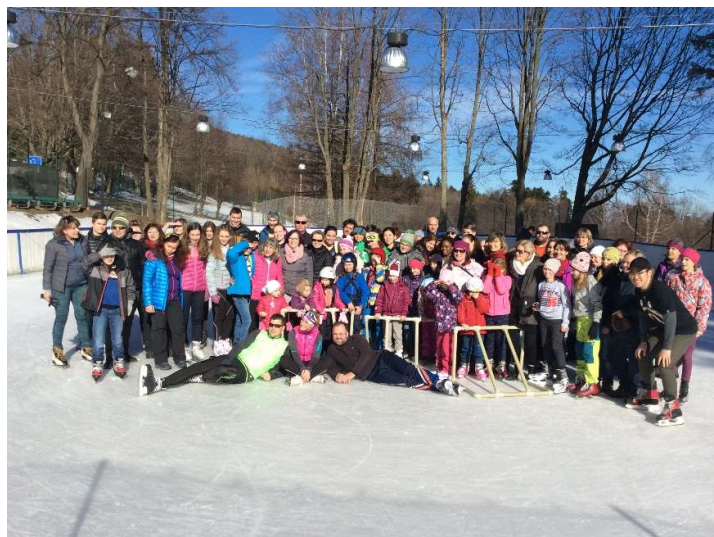
Zimování – 5. ročník (spojeno s programem Edison – návštěva zahraničních studentů)