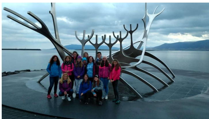
Setkání žáků v rámci projektu Erasmus+ (Island)