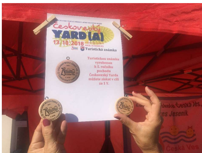
Českoveský Yarda – 5. ročník turistického pochodu