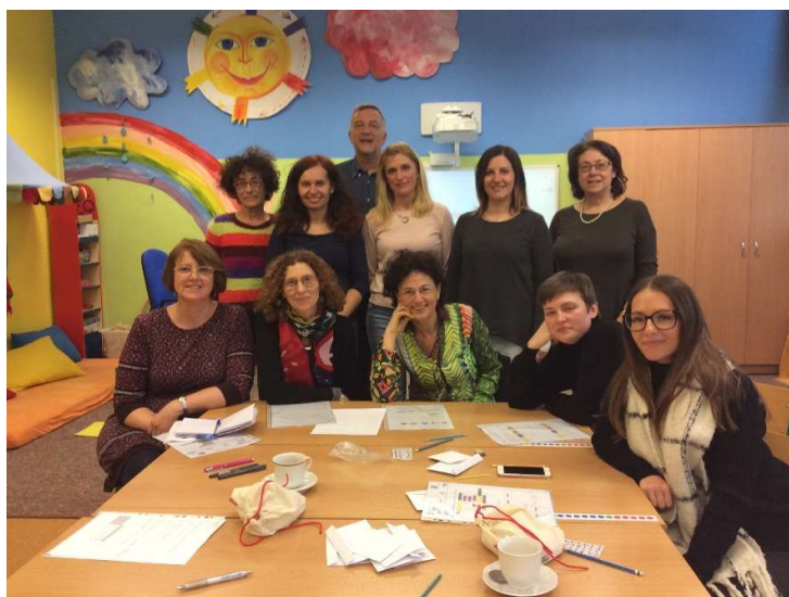
Pracovní návštěva zahraničních kolegů (Erasmus+)