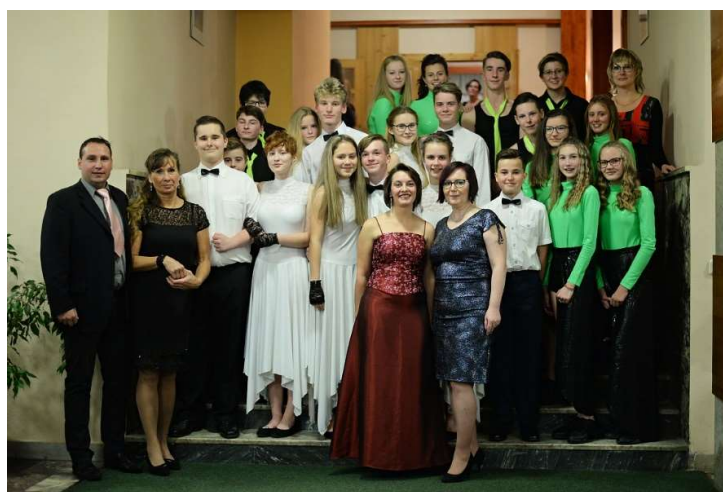
Českoveský školní bál – 5. ročník